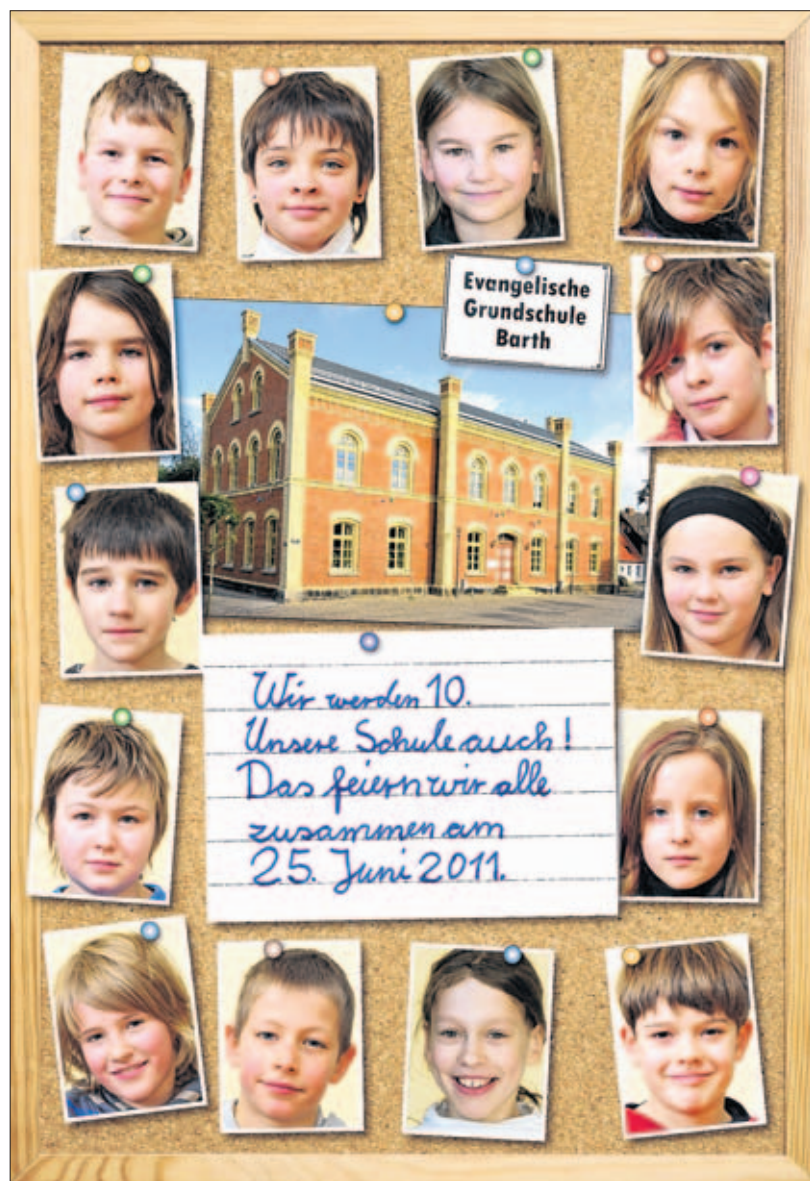
Zum zehnjährigen Bestehen der Evangelischen Grundschule wird am 25. Juni eingeladen. Plakat: Bernd Rickelt