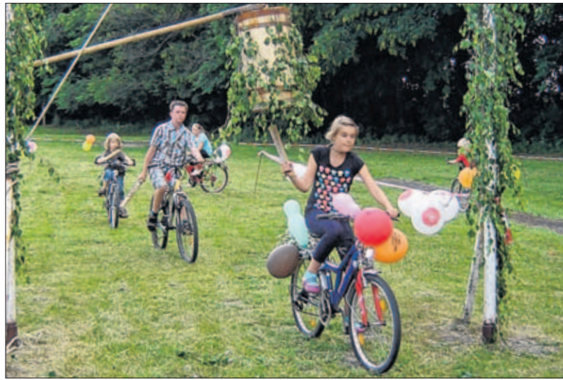
Seit Jahren gibt es in der Gemeinde Divitz das beliebte Kinderfest mit dem speziellen Tonnenabschlagen.